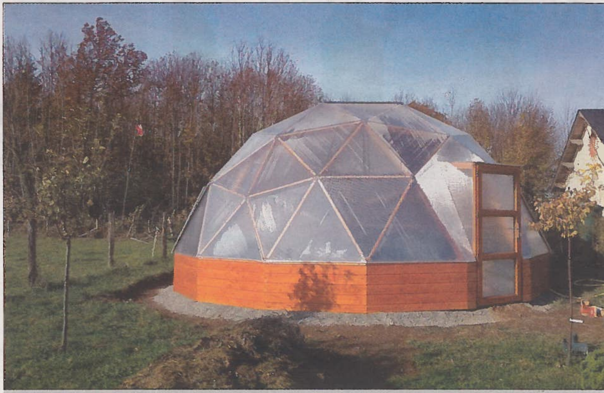
Futuristes ou ancestrales, les serres dômes permettent de jardiner douze mois par an.